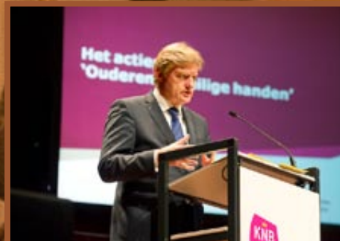
Staatssecretaris Martin van Rijn: ‘Doel is dat ouderen zich veilig voelen en ook veilig zijn.’