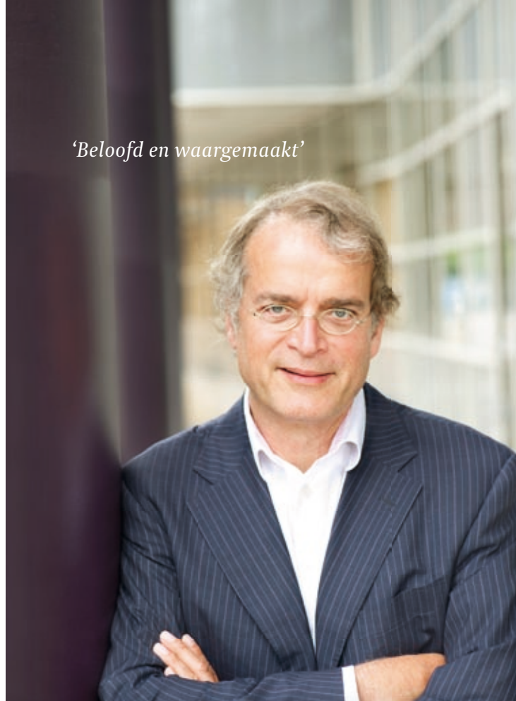
'Beloofd en waargemaakt'